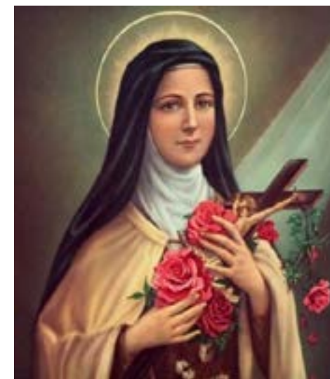
Sv. Terezijo od Djeteta Isusa, zaštitnice misija, moli za naše misionare i misionarke, a sve nas učini suradnicima Papinskih misijskih djela.