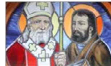
Sveta braća Ćiril i Metod, apostoli među slavenskim narodima i prevoditelji liturgijskih knjiga

Svima vama, poštovani i dragi darovatelji i dobročinitelji, od srca zahvaljujemo. Neka vam dobri Bog uzrati stroku za svako, pa i najmanje dobro djelo.